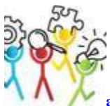
ats2020project @ats2020project 3. Juli